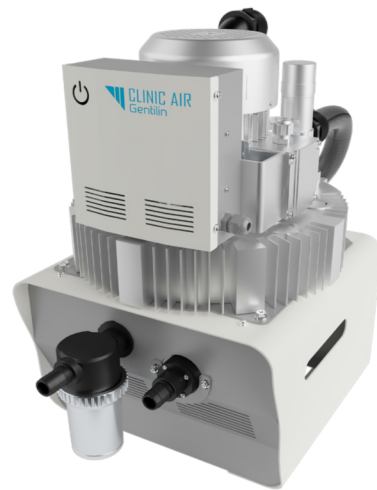
▼ Clinic SW3