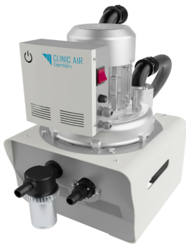
▼ Clinic SW1