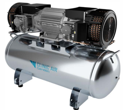
▶ Clinic 6.90