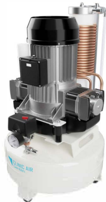
▶ Clinic 3.24