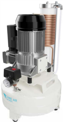
▶ Clinic 1.24