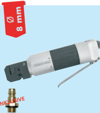
Stanzloch: 8 mm Ø