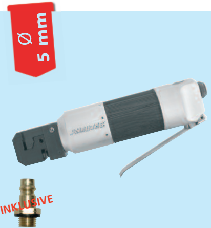
Stanzloch: 5 mm Ø